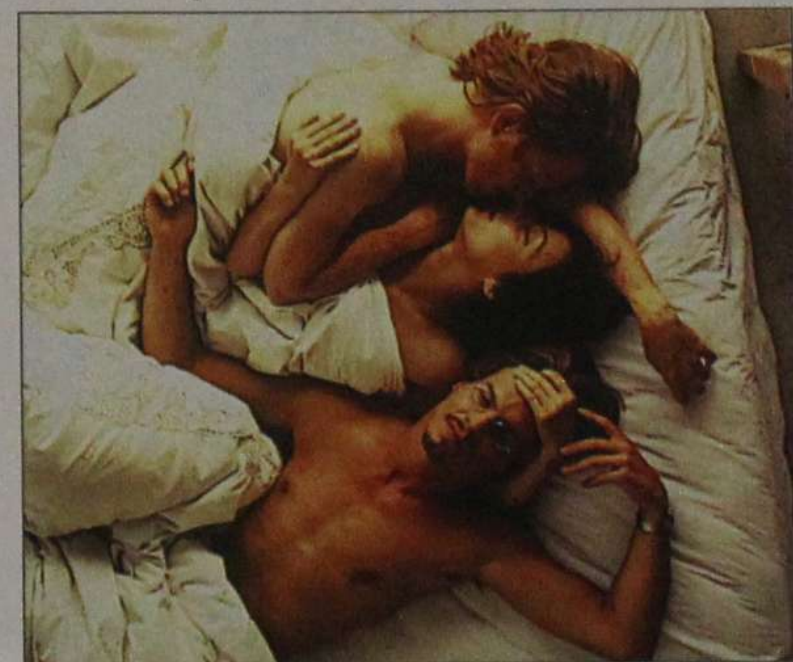
Sleep with Me

A saudar foi o facto de 80% dos filmes serem primeiras e segundas obras. A apontar, apenas a indistincção equívoca entre a Selecção Oficial e a Semana dos Realizadores, esta uma iniciativa que vai no quinto ano e que este ano muda de nome, precisamente para reforçar para onde vai o Fantasporto. Para uma abertura, as mostras mais abrangentes, para avivar a memória ou simplesmente mostrar novos mundos ao mundo do público menos especializado, que se quer recuperar. Entre a descharacterização (do género fantástico) e um papel didáctico de divulgação e revelação, esta selecção opta claramente pelo segundo. O que não é de pouca monta, numa cidade com falta de infra-estruturas culturais, como o Porto. Quanto à nobre missão da des-centralização cultural e ao raro efeito de «descaudalização» da Europa, estamos então conversados. ■