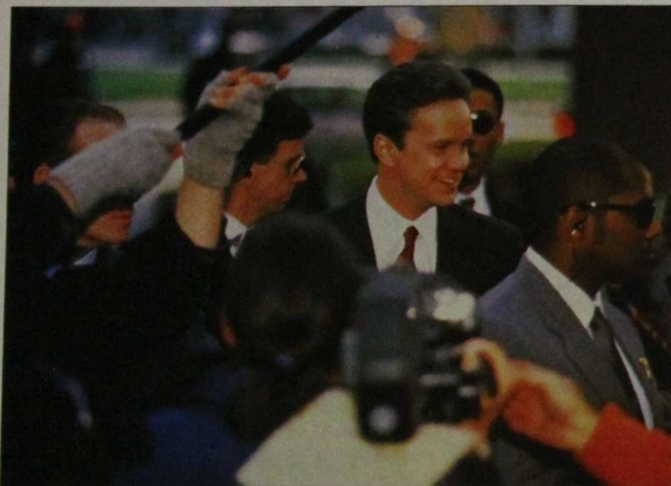
BOB ROBERTS de Tim Robbins com Tim Robbins e Giancarlo Esposito Lisboa: Amoreiras e City Cine

Estes têm sido bons tempos no que toca à estreia de actores na realização. Houve Little Man Tate (recuso-me a recordar o título português) de Jodie Foster e agora há este de Tim Robbins. Vi-o pela última vez no Jogador de Robert Altman, um brilhante exercício de cinismo auto-referencial (cinema feito em Hollywood arrasa Hollywood). Este é igualmente empolgante, mas muito mais corrosivo.