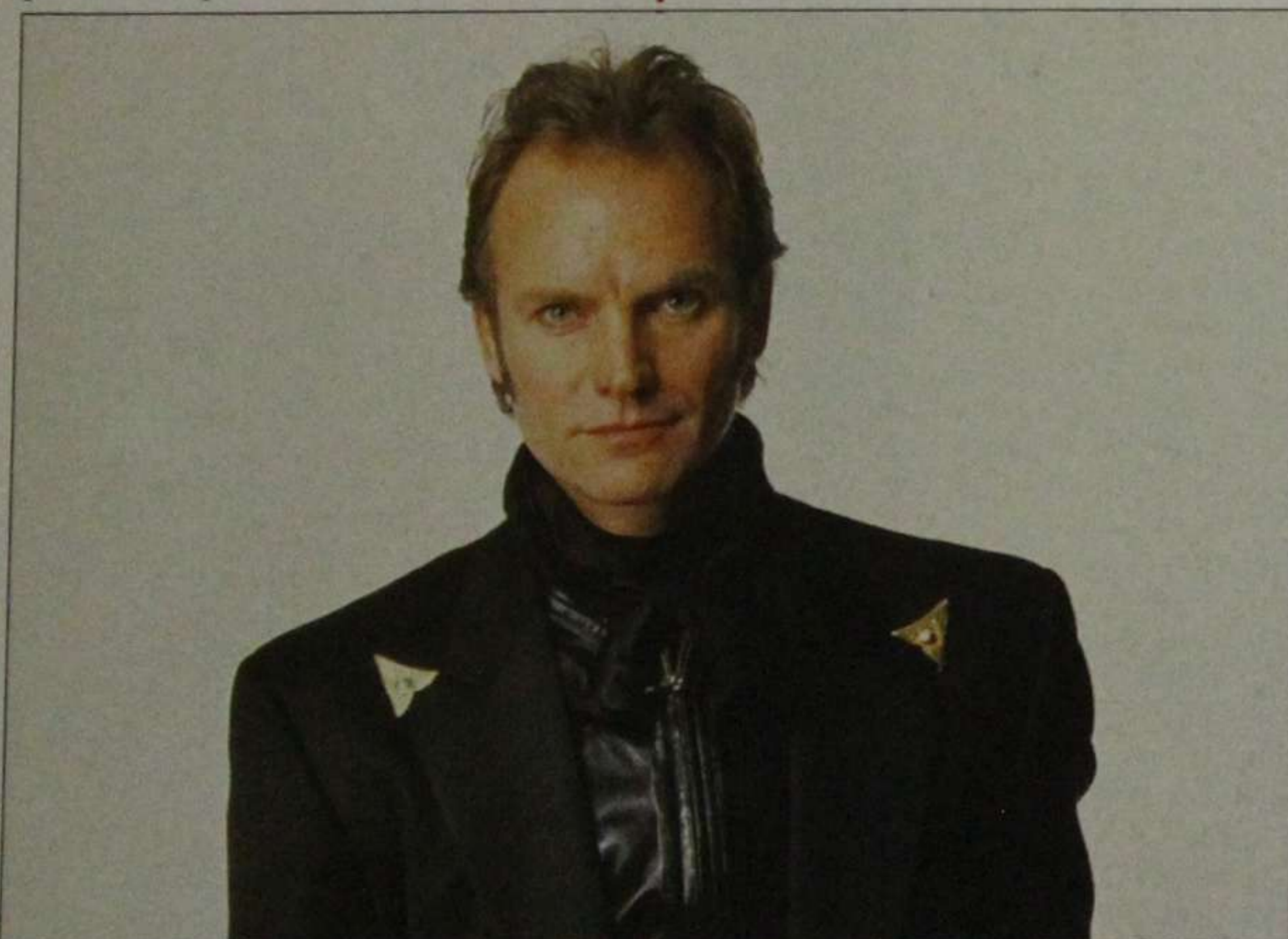
Sting é distinto, porque não é alarve em cena

Como em Londres, deverá iniciar o concerto com If I Ever Loose My Faith In You (do seu mais recente álbum), a que se seguirão temas indispensáveis como Love Is Stronger Than Justice ou Seven Days . Quando recuperar A Day In A Life , dos Beatles, é certo e sabido que os espectadores que têm cartão de fã começa-