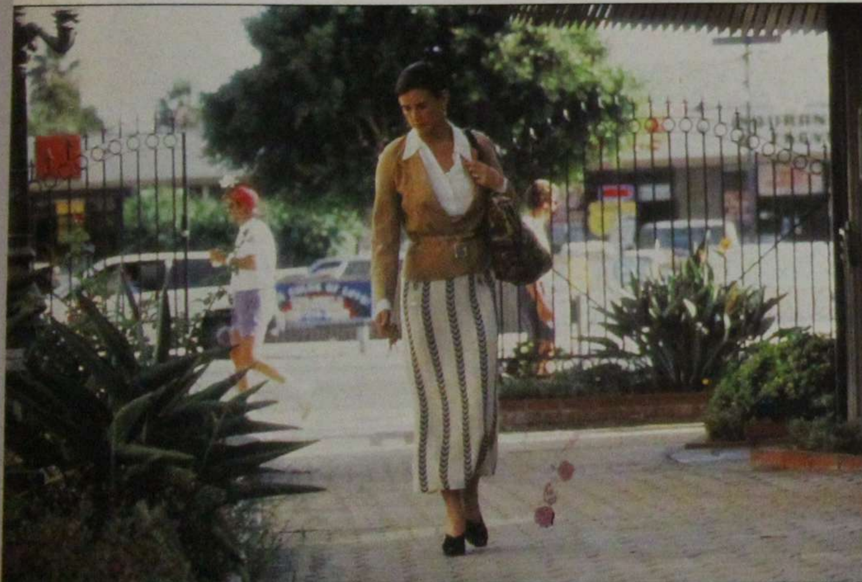
Ela cede o corpo porque quer (Demi Moore)