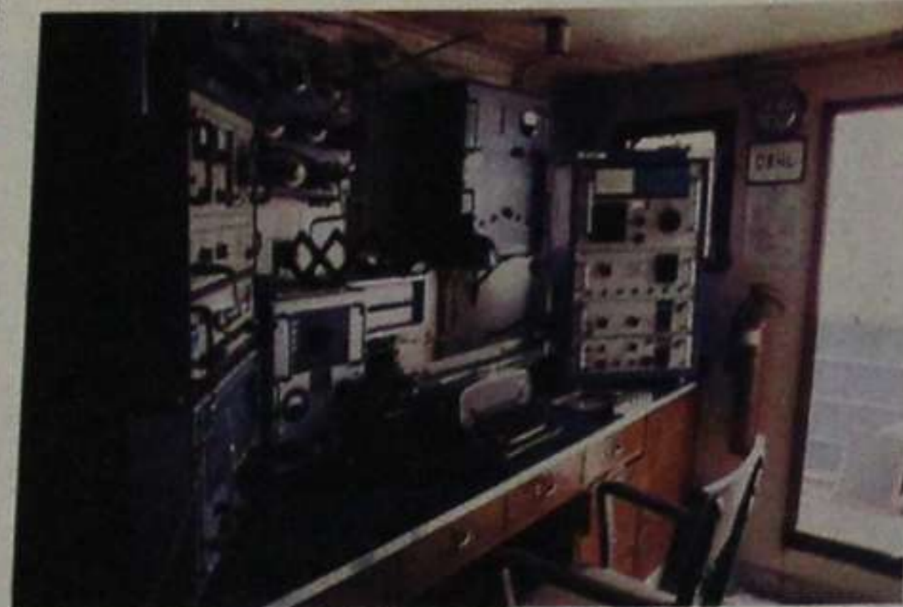
Um dos décors. Anos cinquenta genuínos